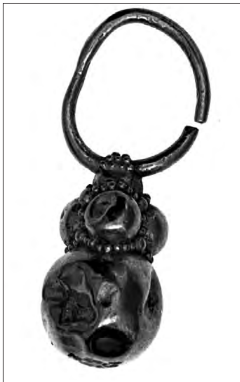
Avar kori fülbevaló Bozsokról a British Museumban, No. 1926,0511.2

pát-medencében, de sem az arany tisztasága, sem pedig az anyagösszetétele nem bizonyítja egyértelműen, hogy hamisítványról lenne szó.