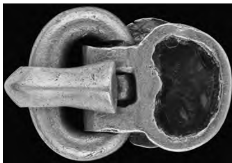
A Christie's árverésén 2021. július 7-én (lot 82) elkelt csat