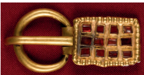
7–8. kép. Wosinsky Mór Múzeum, Szekszárd, 62.2.1 (Nagydorog), 62.5.1 (Szekszárd–Balparászta)