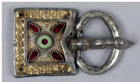
3. kép. The Walters Art Museum, 57.664 4. (Lelőhely: Nagyvárád)