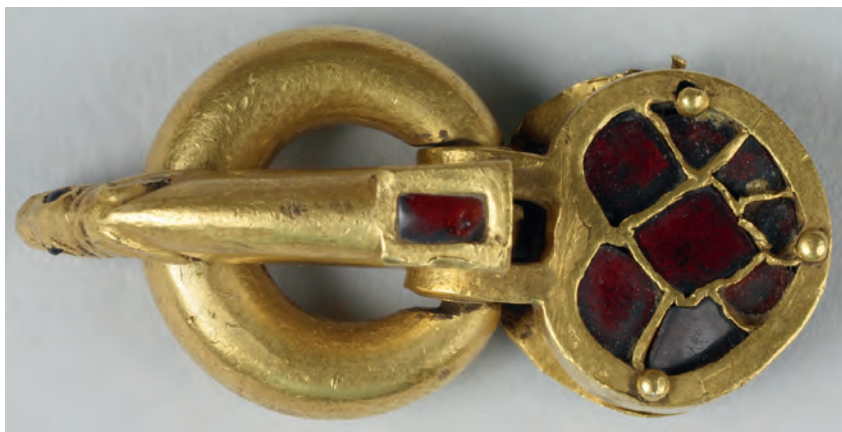
1. 1. kép. A bozsoki aranycsat. The Walters Art Museum, Baltimore, 57.449