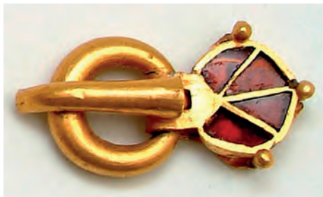
5–6. kép. Hansági Múzeum, Mosonmagyaróvár, 64.1.10.1 (Lébény), 64.1.11.1 (Lébény)