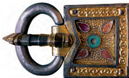
4. kép. LDM Veszprém, 81.1.1 (Kapolcs)