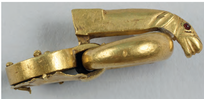
2. kép. A bozsoki aranycsat oldalról. The Walters Art Museum, Baltimore, 57.449