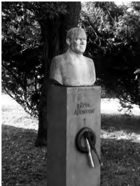
7. kép. Pável Ágoston mellszobra Szombathelyen a Múzeum parkban. (Ács József alkotása.)

tető alá hozzák a Vasvármegyei Múzeumok Barátainak Egyesületét és a Vasi Szemlét, elindítják a Publicationes Sabarienses című kiadványsorozatot.” Kéri Váthot, fogadja el az egyesületi levelezőtagságot.