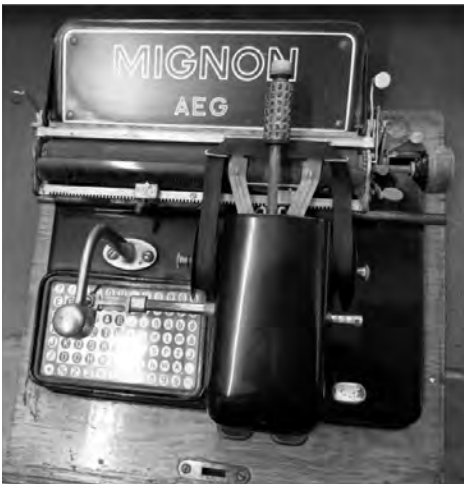
3. kép. A napjainkban már igazi technikai különlegességnek számító, úgynevezett betűhengeres írógép.