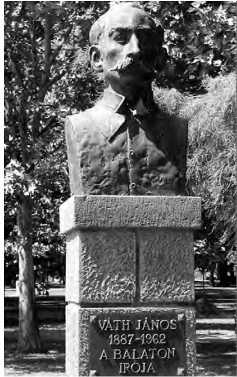
4. kép. Váth János szobra Balatonalmádiban a Szent Erzsébet ligetben. (Mihály Gábor alkotása.)

Váth János életműve mint kulturális örökség része Balatonalmádi Város Értéktárának. 4