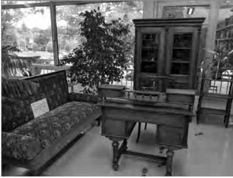
2. kép. A Balatonalmádi Pannónia Művelődési Központ és Könyvtárban megtekinthető Váth János egykori dolgozószobájának részlete.

Megtekinthető egykori dolgozószobájának részlete, íróasztala és ma már igazi kuriózumnak számító betűhengeres írógépe is. 3