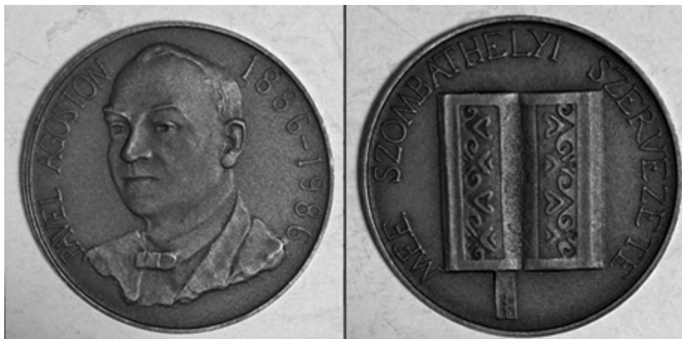
6. kép. A Vas Vármegyei Közgyűlés által adományozható Pável Ágoston-emlékérem elő- és hátoldala. (Kiss Sándor alkotása.)

lékét 1986 óta a Vas Vármegyei Közgyűlés emlékérem adományozásával őrzi. 20