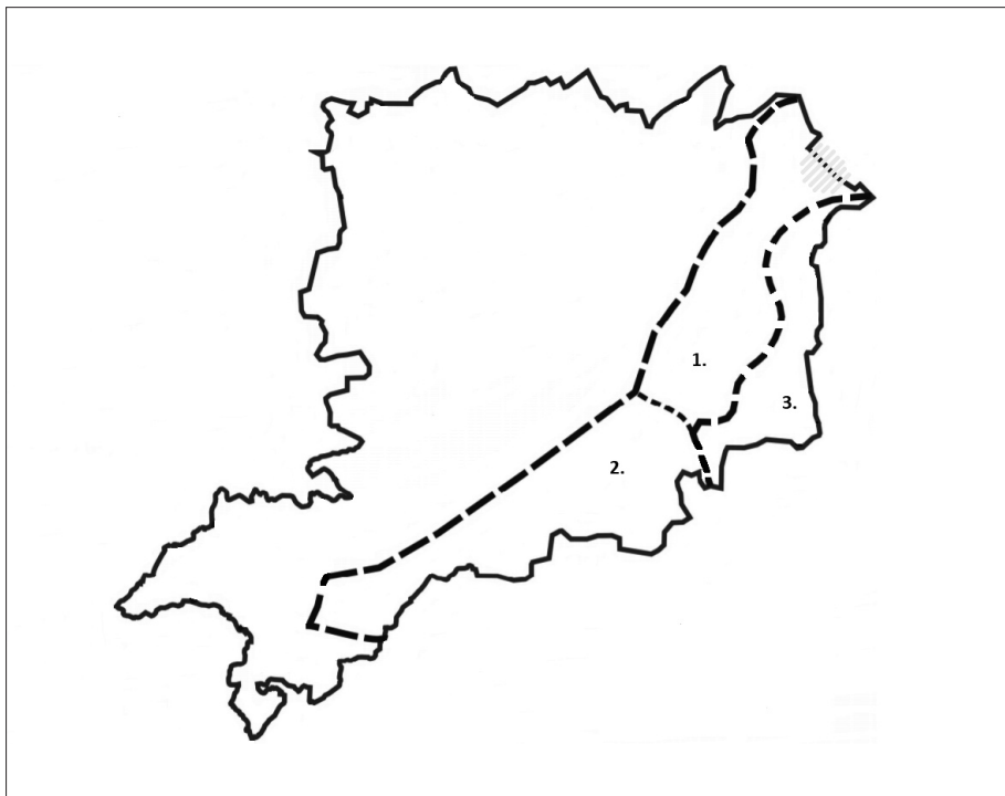
A történelmi Kemenes helyzete a jelenlegi Kemenesvidéken

Annak feltárása céljából, hogy a Kemenes határnév használata milyen térségre terjedt ki, elvégeztem a történelmi Kemenesvidékhez sorolt települések határneveinek vizsgálatát az 1856. és 1857. évi kataszteri térképek alapján. Ennek eredményeként leszögezhető, hogy Kemenes határnév csak két település „Magasi Por” és „Hőgyész” között mutatható ki, 60 ez jó egyezést ad a középkori forrásokból megállapítható lokalizációval.