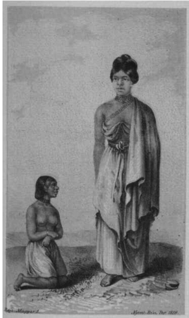
Melléklet Magyar László könyvéből (1859), sokan azt feltételezik, hogy a rajzon a magas előkelő alak Magyar László feleségét, Ozoro hercegnőt ábrázolja