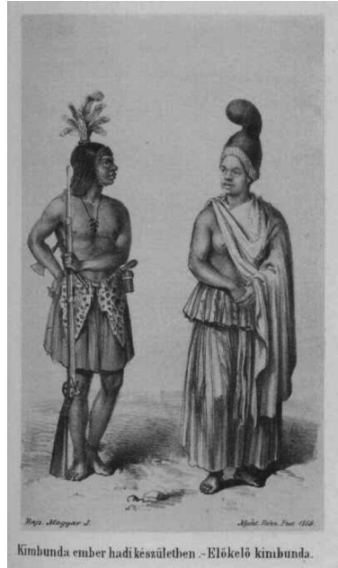
Rajz Magyar László könyvéből (1859)