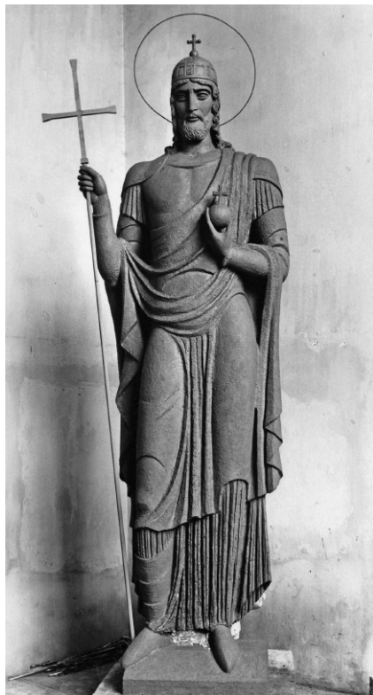
Rumi Rajki István: Szent István, az országepítő, 1939.

Meg kell még említenünk, hogy az ember a modern lélekben mindig talál betegségeket, az érzelmek túltengését. A középkor aszkézise, a fájdalom gyakorlása, a felizgatott képzelődés következtében a középkori szobrászatban az alakok majdnem mindig soványak,