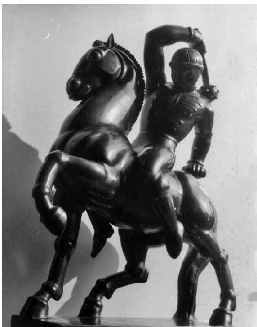
Rumi Rajki István: Lovas, 1934.

A tömegben való látásról kell még szólnunk. Szobrászaink nagy része az élő modell megfigyelésénél a kontúrt figyeli, helytelenül, mert a kontúrt levegő övezi, és a levegőben nincs biztos és meggyőző támpont arra, hogy az aktot jól mutassa meg. A tömegben látás az egyedül helyes, mert biztos alapot nyújt a természet művészi megelevenítésére. Tehát nem a kontúrt kell figyelni, hanem a tömegben megjelenő fényt, amely fény a tömeg irányát és